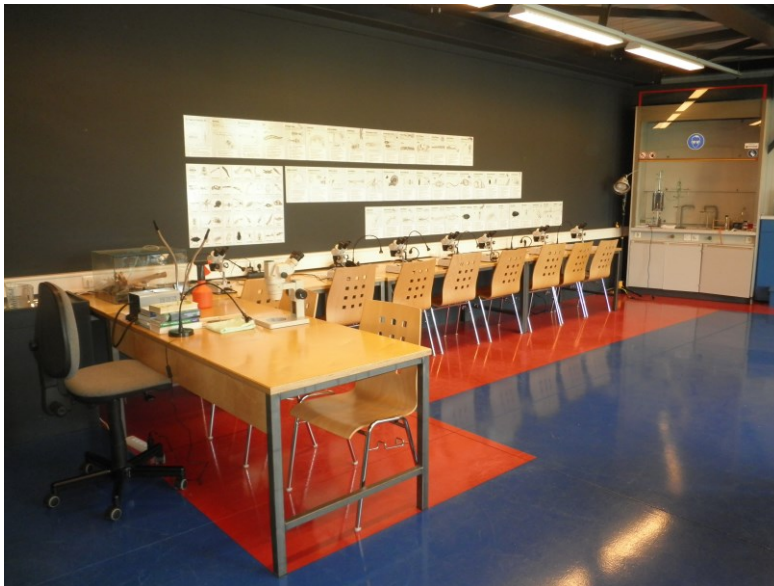
Abbildung 7: Kinderlabor, Ökopark Hartberg (eigene Bearbeitung).

Auf dem folgenden Foto ist das Labor zu sehen: