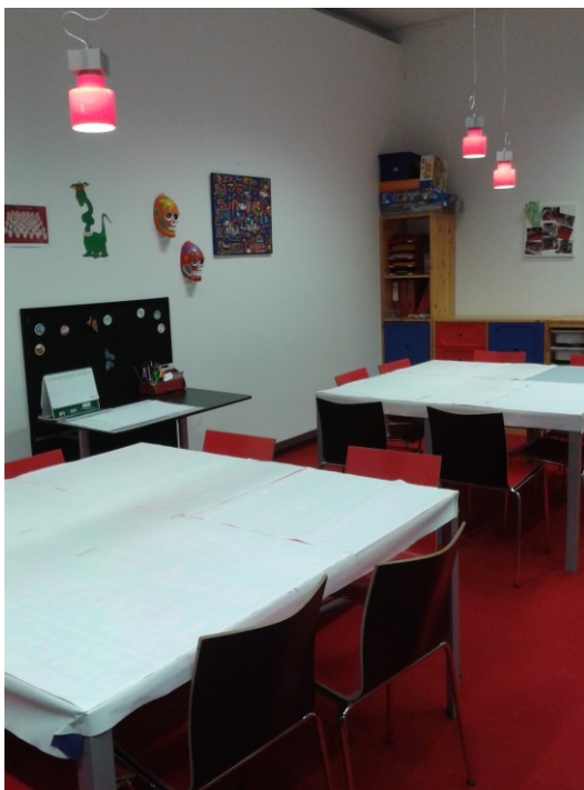
Abbildung 8: Workshopraum, Kunsthalle Leoben (eigene Bearbeitung).

Auch für SchülerInnen gibt es die Möglichkeit in der Bluebox einen Film zu drehen und diesen, auf CD-Rom gebrannt, mitzunehmen. Die Kinder dürfen für die Gestaltung des Filmes das Thema frei wählen (vgl. Kunsthalle Leoben o.J.).