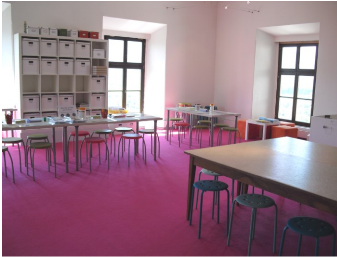
Abbildung 6: Kinderatelier, Schloss Trautenfels (eigene Bearbeitung).

Künstler /einer Künstlerin der Region gemeinsam kreativ zu werden (vgl. Schloss Trautenfels o.J.).