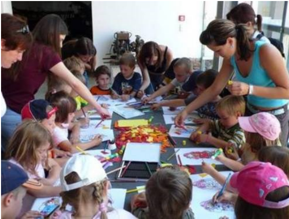
Abbildung 5: Kinderbereich, Feuerwehrmuseum Groß St. Florian (Steirisches Feuerwehrmuseum o.J.).

Auch für Kindergärten bietet das Feuerwehrmuseum ein museumspädagogisches Konzept. Ziel ist es, den jüngsten BesucherInnen die Inhalte auf spielerische Art und Weise näherzubringen. Das Museumsmaskottchen Funki und unterhaltsame Spiele sorgen für spannende Erlebnisse im Ausstellungshaus (vgl. Steirisches Feuerwehrmuseum o.J.).